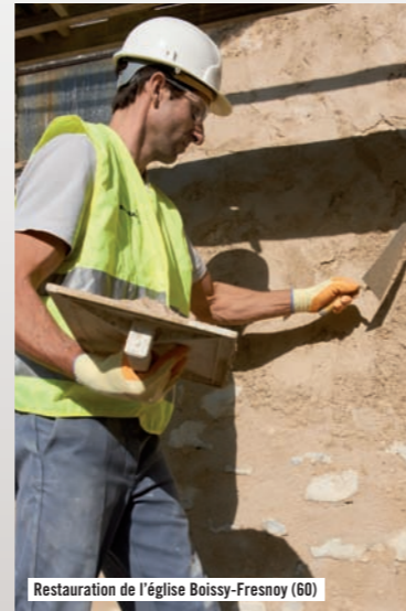
Restauration de l'église Boissy-Fresnoy (60)

Enduit à pierres vues : adhérente aux pierres anciennes