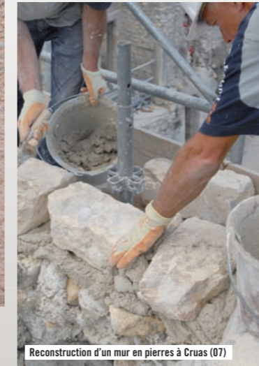
Reconstruction d'un mur en pierres à Cruas (07)

Maçonnerie de pierres : 100% naturelle pour respecter les bâtis anciens