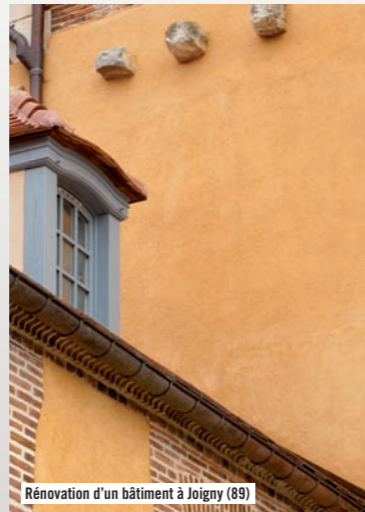
Rénovation d'un bâtiment à Joigny (89)

Enduit extérieur : transparente pour reproduire les teintes locales des enduits traditionnels