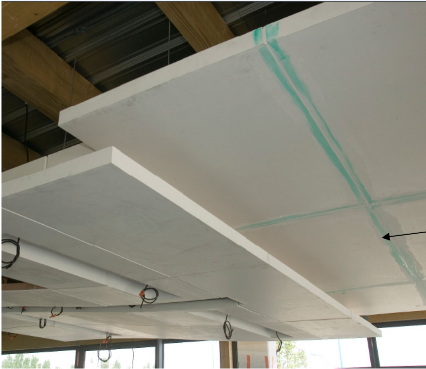
Système de jointoiement sans bande à joint

Qualité : Les pièces PLAtec™ ont une finition angles et arêtes particulièrement soignés , de haute qualité