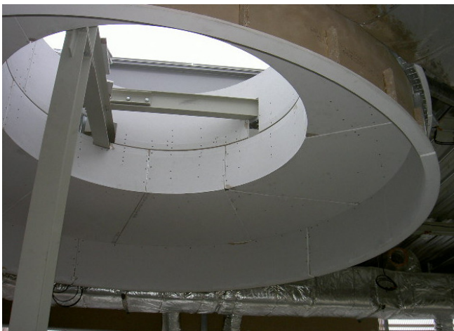
Exemple réalisation Bioscope Ungersheim avant