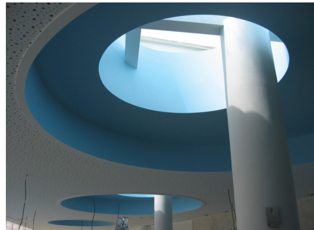
Exemple réalisation Bioscope Ungersheim après