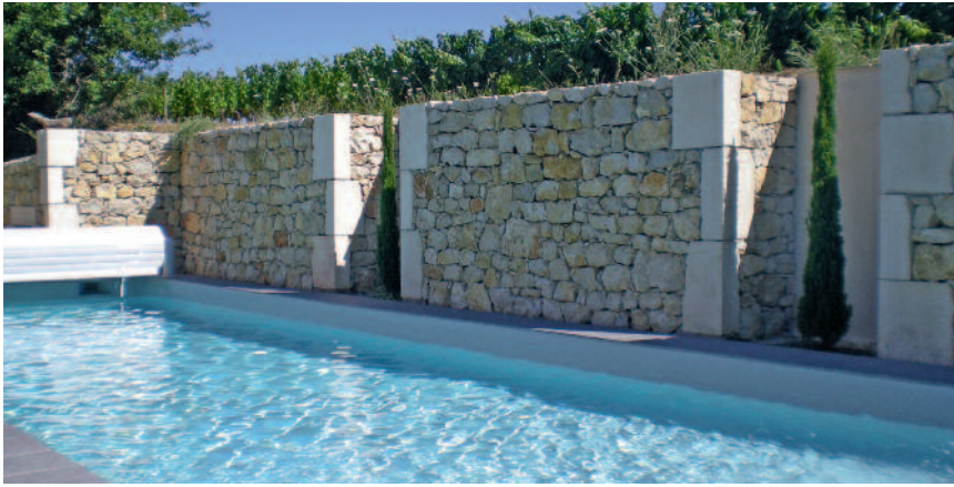
UN MUR DE SOUTÈNEMENT AUTHENTIQUE Imitation parfaite de la pierre naturelle locale.