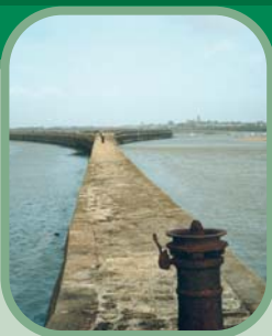
Rejointoiement au mortier d'une digue