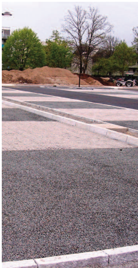
Une alternance de couleurs est rendue possible par nos dalles